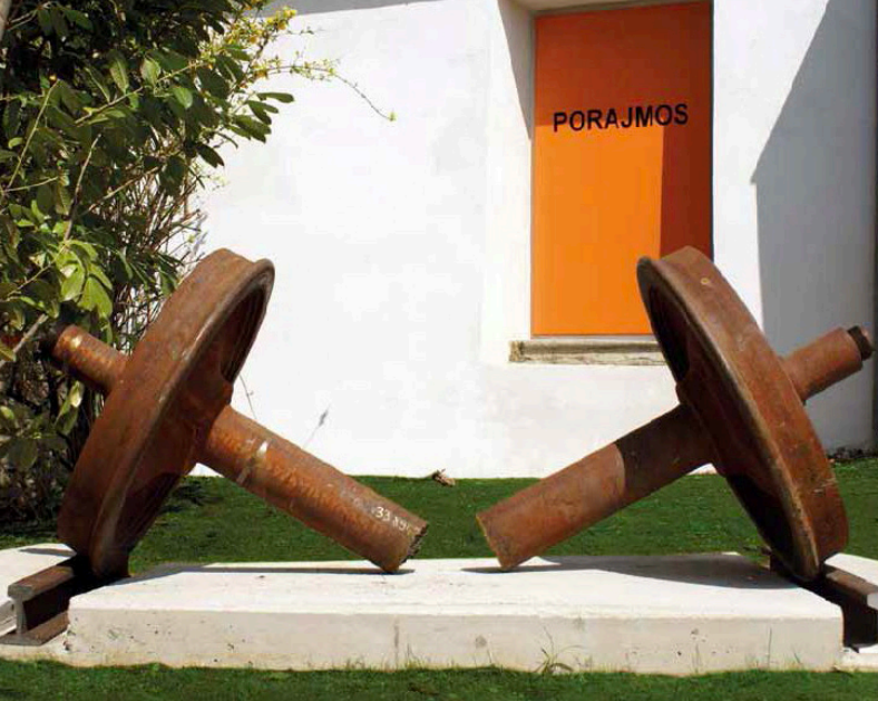
Das Denkmal in Weizberg (Weiz) erinnert seit 2012 an den NS-Genozid an Roma/ Romnia.