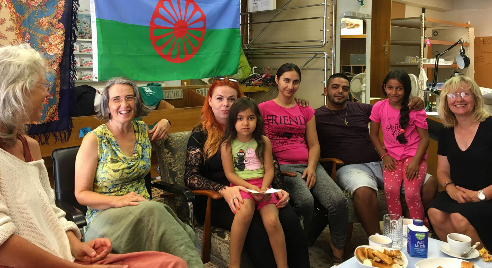
Die Angebote der Caritas zielen auf nachhaltige Integration und Selbstermächtigung.