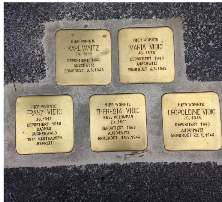
„Stolpersteine“ für Roma/Romnia-Opfer in Graz

Obwohl die Steiermark ein wichtiger Knotenpunkt der Roma/ Romnia-Verfolgung war, gibt es nur wenige Gedenkort. So erinnert ein Denkmal in Weizberg (Weiz) seit 2012 an den NS-Genozid und in Graz existieren seit kurzem mehrere „Stolpersteine“ für Roma/ Romnia-Opfer.