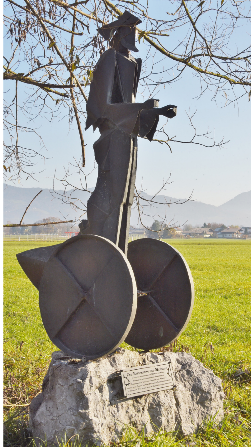
Mahnmal des Bildhauers Zoltan Pap beim ehemaligen Zwangslager Maxglan/Salzburg

Nach dem Fall des Eisernen Vorhangs bewogen politische Umbrüche, wirtschaftliche Not und das Aufflammen von Rassismus viele Roma/Romnija, ihre Heimat zu verlassen. Dies betraf insbesondere Roma/Romnija aus Rumänien und – infolge von Bürgerkrieg und „ethnischen Säuberungen“ – aus Ex-Jugoslawien (Bosnien-Herzegowina, Kosovo).